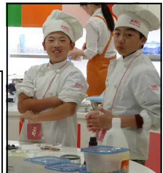
キザニアでのシェフ体験