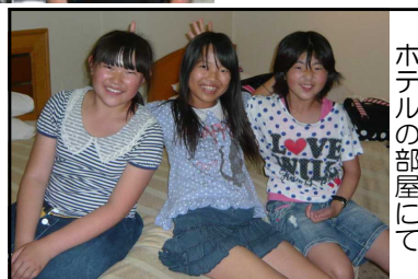
ホテルの部屋にて