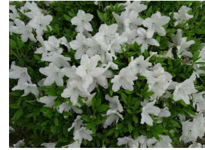
職員室 前の白 いサツ キ