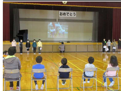
運営委員による学校紹介