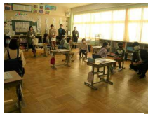
⇐ 3年 友情・信頼