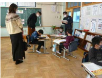
4年 ⇒ 善悪の判断・自立 自由と責任