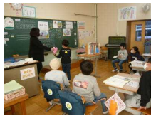
⇐ 1年 親切・ 思いやり

校内持久走大会と同日の午後に全学年で「特別の教科 道徳」の授業参観を行いました。子供たちは普段の授業よりも緊張した様子でしたが、積極的に話し合う姿も見られました。悲しい事件が多い時でしたが、お家の人と道徳的価値について一緒に考える良い機会となりました。