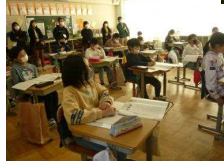
6年 ⇒ 善悪の判断・自立 自由と責任