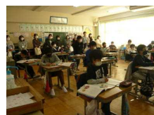
⇐ 5年 正直・誠実