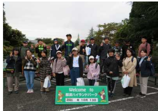
6年生 那須ハイランドパーク