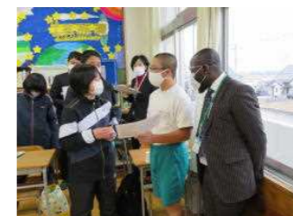
「コミュニケーション能力の育成」