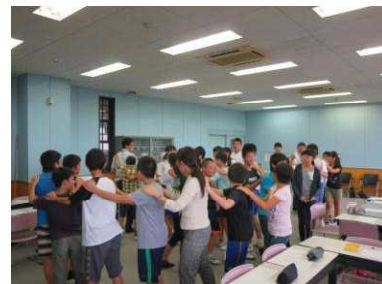
児童・生徒交流会 アイスブレイキング