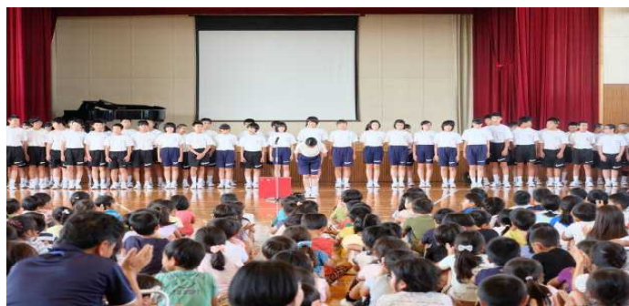
〈国分寺東小における合唱の発表〉