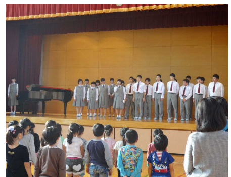
〈吉田西小における合唱交流〉