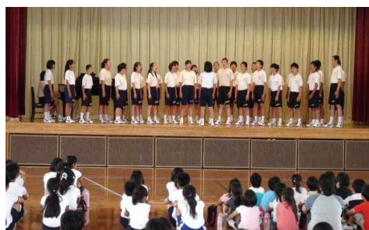
〈国分寺西小における合唱の発表〉