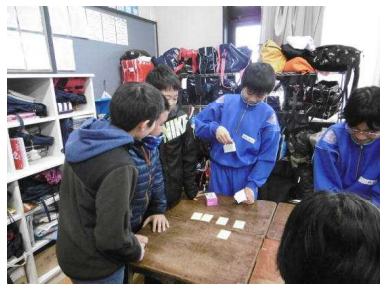
入学説明会 合同授業