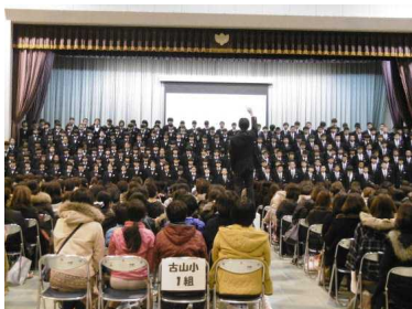
入学説明会 歓迎の合唱

「クリーン作戦」では、中学生が出身小学校を訪れ、小学生とともに小学校の校舎や地域の公園の清掃を行った。