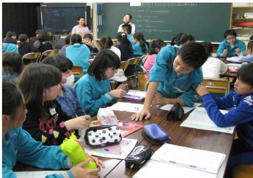
〈小学6年生児童の中学校授業体験〉