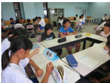
児童・生徒交流会 意見交換