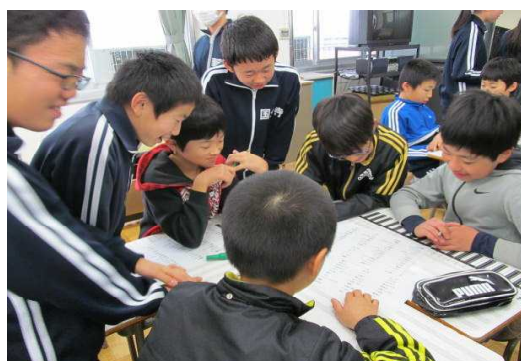
〈新入生オリエンテーション体験授業〉