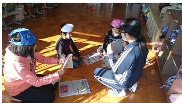
〈子ども未来プロジェクトの清掃活動交流〉