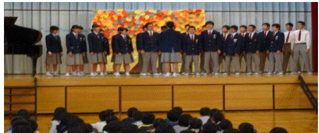
〈薬師寺小における合唱交流〉