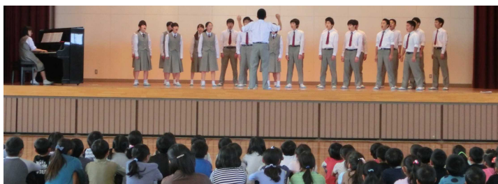
〈吉田東小における合唱交流〉