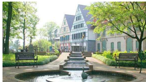
グリムの館 Grimm's House