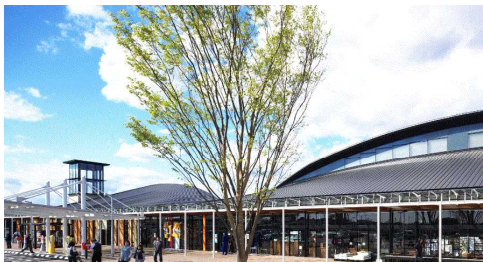
道の駅しもつけ Shimotsuke Road Station