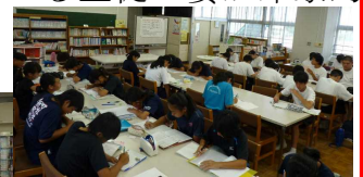
午前中に3時間学習しました。